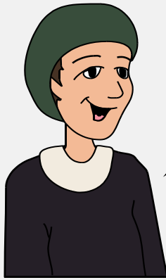
זוה סתם סופר

אַחַת, שְׁתַּיִם, שְׁלוֹשׁ, אַרְבַּע, חֲמִישׁ