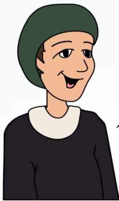
זדה סתם סופר

אַחַת, שְׁתַּיִם, שְׁלוֹשׁ, אַרְבַּע, חֲמִשׁ