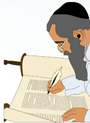
זה סופר סת"ם

סת"מ = ספרי תורה, תפילין, מזוזות ומגילות